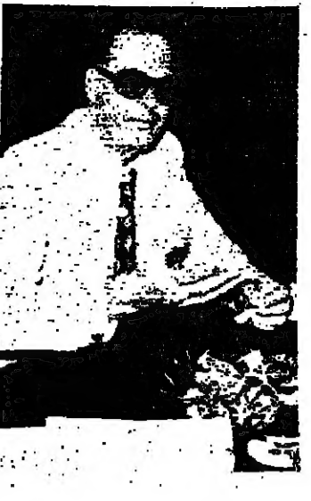
الرئيس الحصن خلال ندوته الصحفية أمس